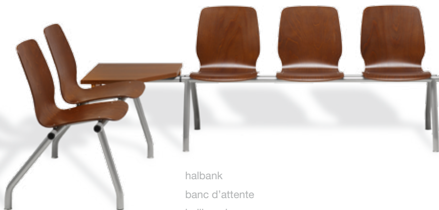
halbank banc d'attente hallbench

kunststof armlegger accoudoir mélaminé plastic armrest