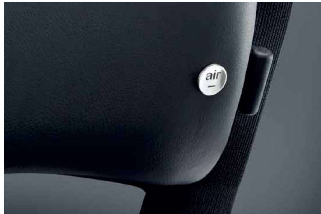
Die Lordosenstütze ist höhenverstellbar, Air Pressure-Technologie ermöglicht eine individuelle Einstellung des Stützvolumens