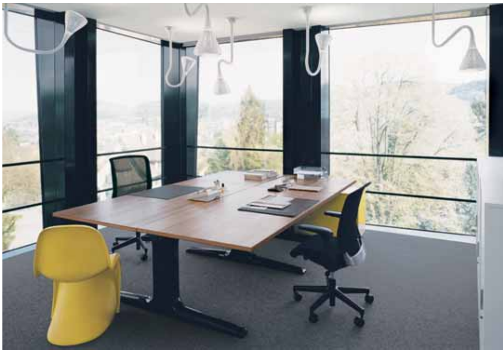
Xantos, Helvetia Patria, St. Gallen, Architektur Herzog de Meuron