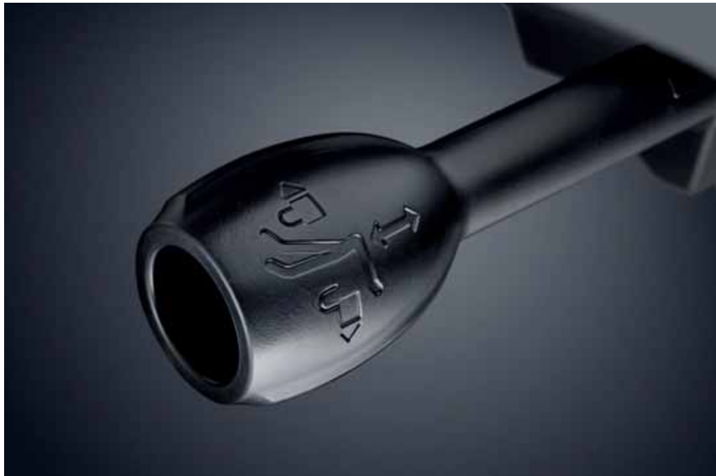
Bedienhebel mit selbsterklärender, intuitiver Verstellung