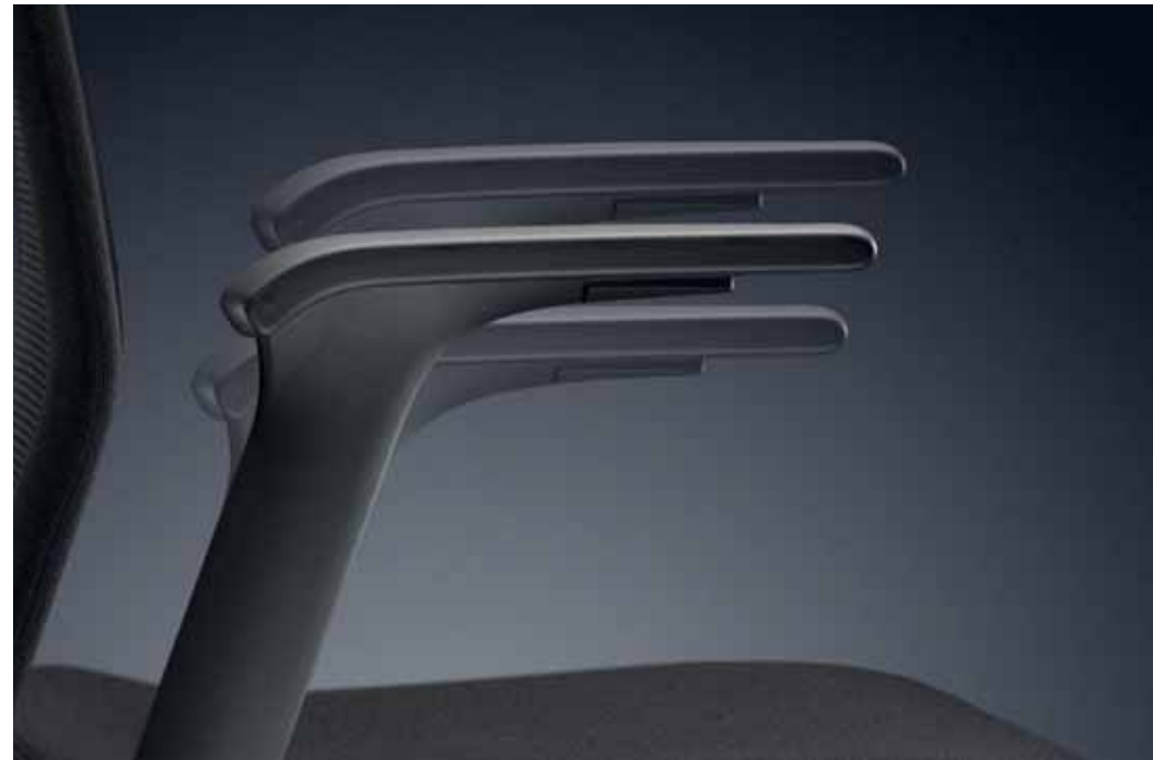
Breiten- und höhenverstellbare Armlehnen