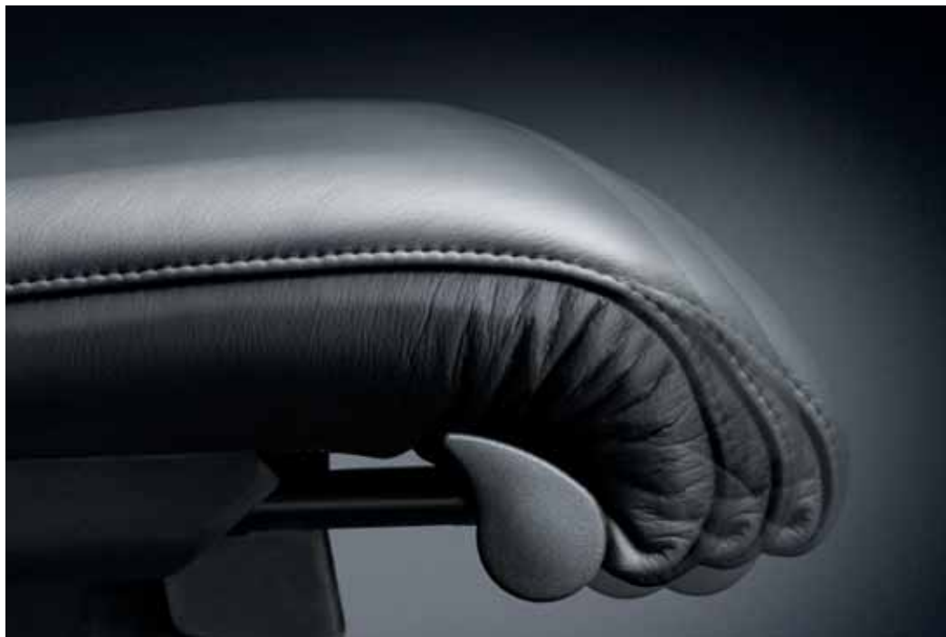
Die Aktiv-Sitztiefenverstellung verlängert effektiv die Sitzfläche und somit die Auflagefläche für die Oberschenkel