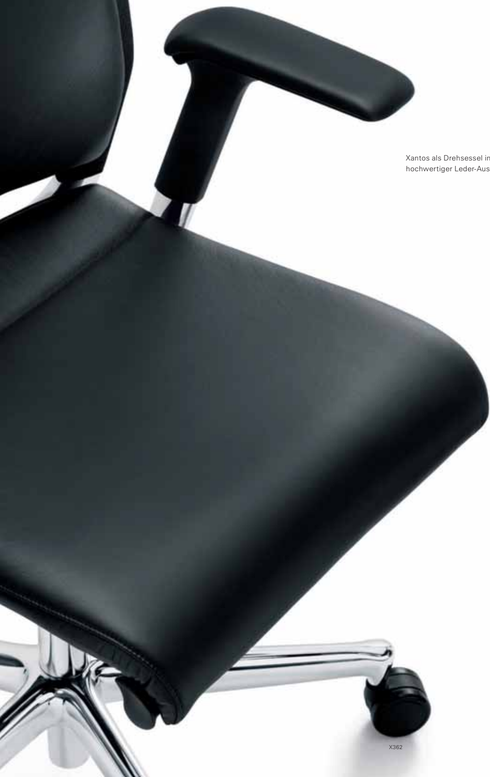
Xantos als Drehsessel in hochwertiger Leder-Ausführung.